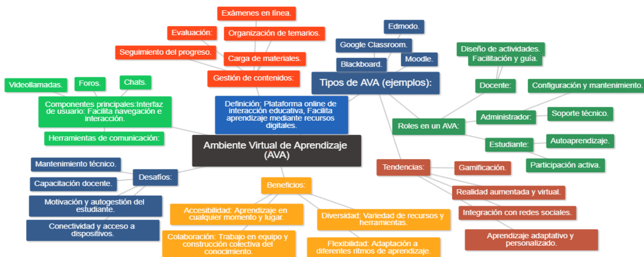
Mapa mental de las características de un AVA

Nota: Adpatado del Driscoll, M (2005). Aprendizaje en línea: una perspectiva moderna.