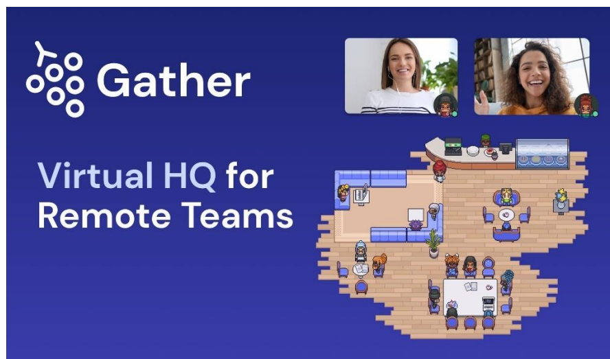
Figura 10: Imagen de presentación de la interfaz Gather.town

Nota: Imagen tomada de la página Gather.town como referencia de presentación de la propuesta.