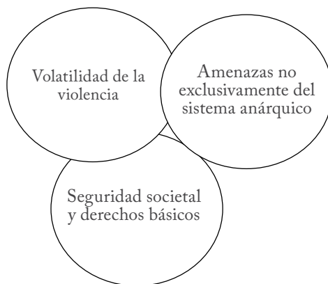
Figura 9.2. ¿Por qué ampliar el concepto de la seguridad? Las condiciones enmarcadas en la seguridad societal y los derechos básicos, son directamente proporcionales a la construcción de la seguridad humana. Elaboración propia con base en Cardona, 2004; Cavalletti, 2010 y Kaldor, 1999.

La seguridad humana intenta desarrollar una integralidad propiamente más profunda y amplia que la seguridad nacional e incluso internacional. En principio, esta noción tiene como finalidad determinar al objeto referente en la condición humana y de persona en vez de la lógica clásica Estado-céntrica. La seguridad humana, concepto construido dentro de las Naciones Unidas, es un marco dinámico para hacer frente a las amenazas de carácter intersectorial y generalizado con que se enfrentan los gobiernos y las personas 1 (United Nations Trust Fund for Human Security, 2005).