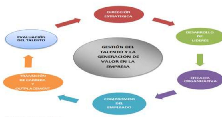
Figura 2. Gestión del talento