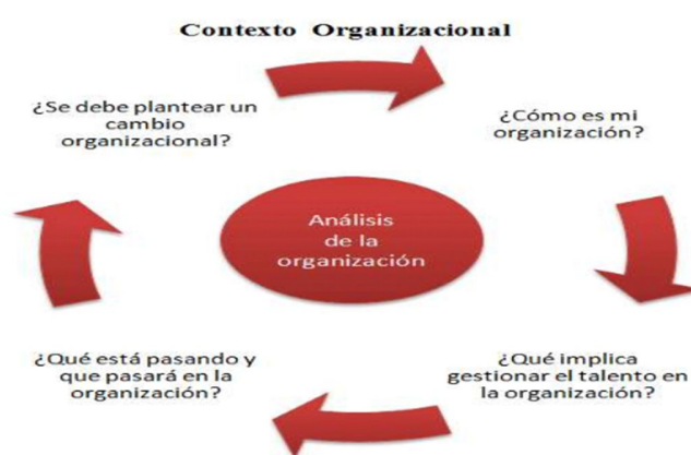
Figura 1. Contexto organizacional

atraer y retener el talento, sino en brindar especial atención a identificar, desarrollar y desplegar a las personas que ya forman parte de la empresa, eliminando de esta forma las barreras en los procesos de selección, formación y compensación. por último, es fundamental que todos los colaboradores, independientemente del cargo y posición que ocupen en la estructura organizacional, se involucren en todas las fases del proceso para apoyar la iniciativa como se muestra en la imagen 1. Alvarado, G (2011)