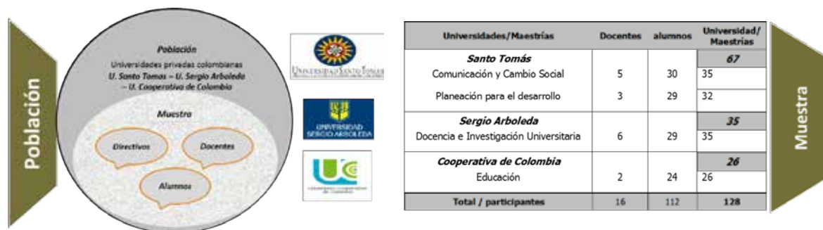
Población universidades privadas colombianas